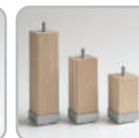
Holzfuß mit Metallkappe