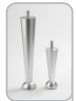
Metallinen kartiojalka (alumiini)