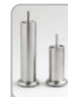
Metallinen putkijalka (alumiini)