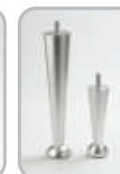
Metallinen kartiojalka (alumiini)