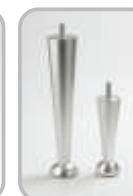
Metallinen kartiojalka (alumiini)