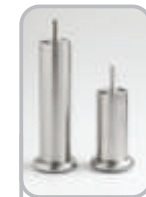
Metallinen putkijalka (alumiini)