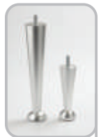
Metallinen kartiojalka (alumiini)