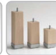
Holzfuß mit Metallkappe